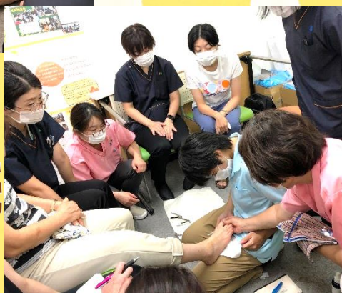
指導を受けながら 実践！今日の日の 為に先輩看護師が 爪を伸ばしてくれ ました