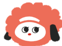
東京都訪問看護ステーション協会 イメージキャラクターほなと

「新任訪問看護師交流会申込書」をご記入の上、訪問看護ステーションけせら ( info@houkankesera.net ) まで直接お申し込みください。 締切：2/15(火)